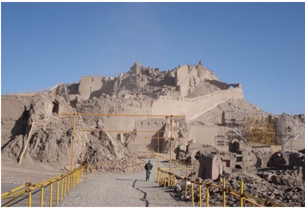
پروژه‌ی مرمت «ارگ سریز» برنده جایزه‌ی ممتاز سال ۲۰۱۴ یونسکو در رقابت حفاظت از میراث فرهنگی در منطقه آسیا و اقیانوسیه

و مذهب را برگزار کرد. در این سمینار دانشمندان، رهبران مذهبی، رهبران بومی، نمایندگانی از کارگزاری‌های سازمان ملل، سازمان‌های مردم‌نهاد و کمیته بین‌المللی صلیب سرخ به بحث در خصوص نقش فرهنگ و مذهب در اجرای آرمان‌های توسعه پایدار پرداختند.