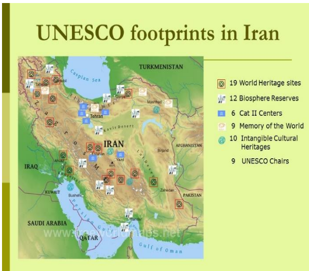
پوشش جغرافیایی فعالیت های یونسکو

۵. ایجاد جامعه معرفتی فراگیر از طریق اطلاعات و ارتباطات.