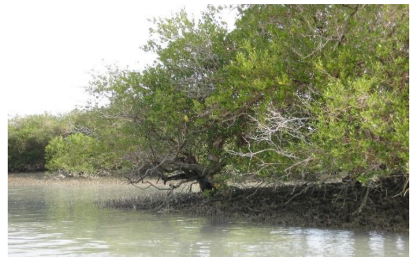
ذخیره‌گاه زیست‌کره حرا در استان هرمزگان

آموزش: یونسکو از فعالیت های جمهوری اسلامی ایران برای دستیابی به چهارمین هدف از اهداف توسعه پایدار (اطمینان از آموزش باکیفیت و فراگیر و ترویج فرصت‌های یادگیری مادام العمر برای همه) در حوزه های سیاست‌های آموزشی، برنامه ریزی و تعیین خط‌مشی، گردآوری داده های آموزشی، تحلیل و گزارش دهی، سوادآموزی و یادگیری مادام العمر، آموزش‌های فنی و حرفه ای و فن‌آوری اطلاعات و ارتباطات در آموزش، حمایت می‌نماید. این سازمان از طریق تبادل دانش و اطلاعات، ارائه‌ی پیشنهاداتی برای سیاست‌گذاری و ظرفیت‌سازی، تسهیل گفتگوها برای ایجاد خط‌مشی و گسترش مشارکت، در اجرای ملی چهارمین هدف از اهداف توسعه پایدار نقش دارد. یونسکو در اجرای برنامه های آموزشی خود با شرکای متعددی از جمله کمیسیون ملی یونسکو در جمهوری اسلامی ایران، وزارت آموزش و پرورش، سازمان نهضت سوادآموزی و سازمان فنی و حرفه ای همکاری نزدیکی دارد.