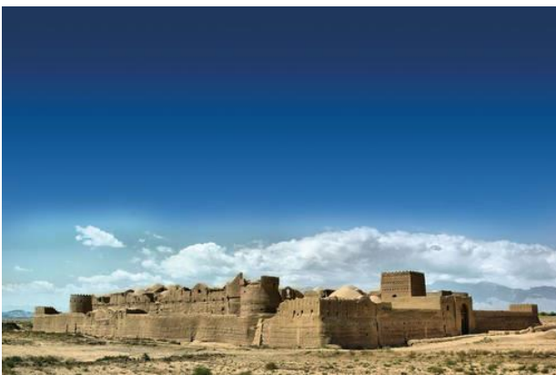
ارگ باستانی بام در استان کرمان: منظر فرهنگی بام در میراث جهانی یونسکو ثبت شده است.

و مذهب را برگزار کرد. در این سمینار دانشمندان، رهبران مذهبی، رهبران بومی، نمایندگانی از کارگزاری‌های سازمان ملل، سازمان‌های مردم‌نهاد و کمیته بین‌المللی صلیب سرخ به بحث در خصوص نقش فرهنگ و مذهب در اجرای آرمان‌های توسعه پایدار پرداختند.