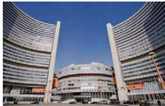
دفتر ملل متحد در وین