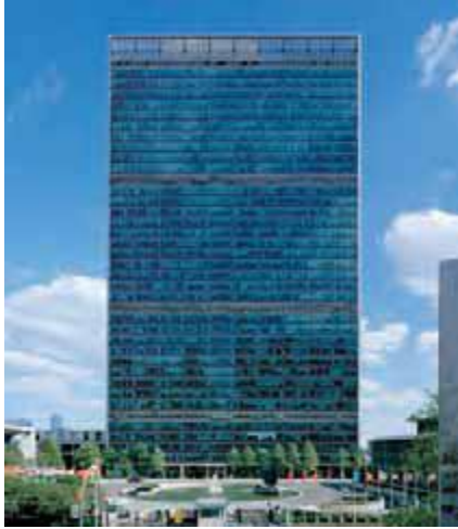
مقر سازمان ملل در نیویورک