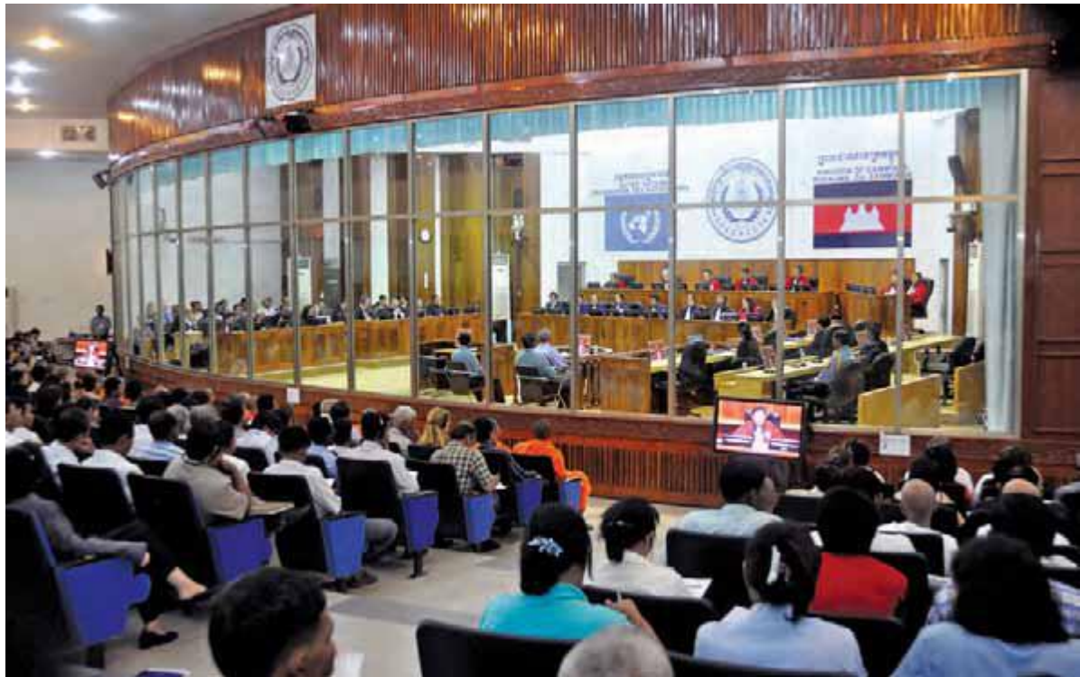
شعب فوق العاده دادگاه های کامبوج در زمان جلسه

« دادگاه ویژه برای لبنان کسانی را تحت پیگرد قانونی قرار می دهد که مسئولیت حمله تروریستی ۱۴ فوریه ۲۰۰۵ در بیروت را دارند، که منجر به مرگ نخست وزیر لبنان، رفیق حریری، و مرگ یا آسیب دیدگی بسیاری دیگر شد.