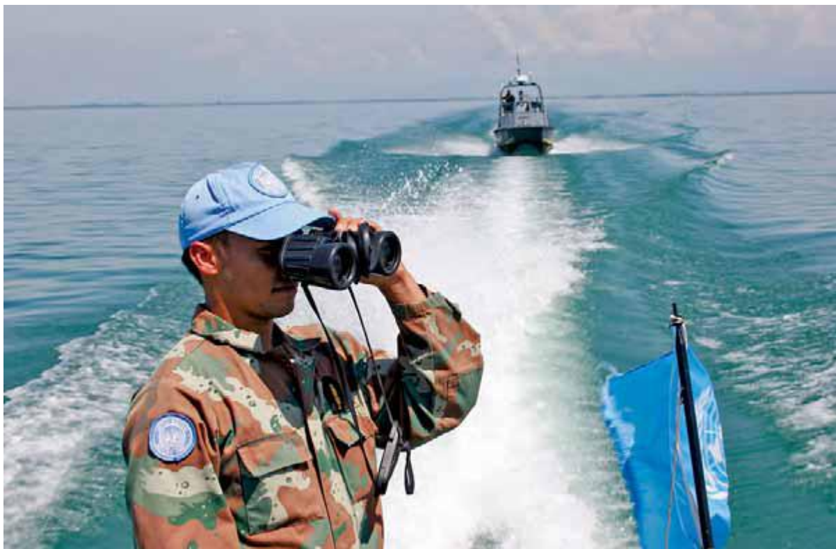
گشت زنی و دیده بانی دو مسوولیت مهم صلح بانان ملل متحد در عملیات به شمار می روند.

سازمان ملل متحد همچنین نقش عمده ای در پایان دادن به مخاصمات در کنگو (۱۹۶۴)، جنگ بین ایران و عراق (۱۹۸۸)، و درگیری ها در السالوادور (۱۹۹۲) و گواتمالا (۱۹۹۶) ایفا کرده است. موافقت نامه های صلح تحت هدایت ملل متحد رشد اقتصادی پایدار را در موزامبیک (۱۹۹۴) موجب شده و به استقلال تیمور شرقی (۲۰۰۲) منجر شده است. در دسامبر ۲۰۰۵، ماموریت حفظ صلح سازمان با موفقیت در سیرالئون به پایان رسید.