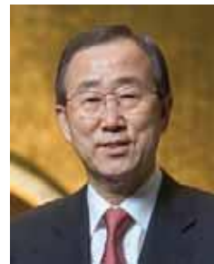
بان کی مون ( کره جنوبی ): ۲۰۰۷ تا کنون