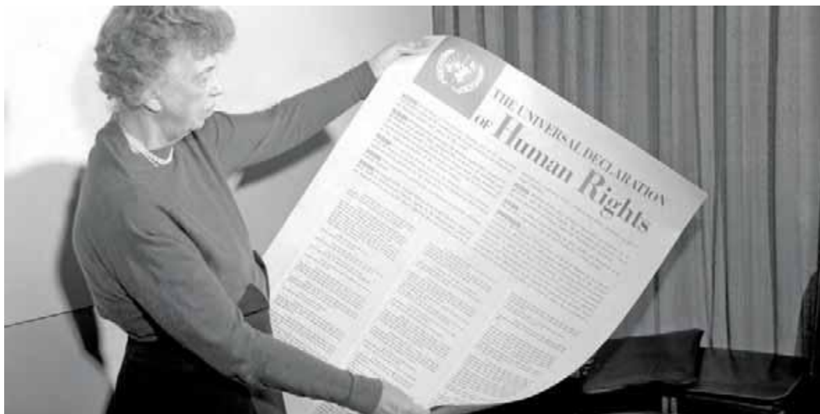
النور روزولت، همسر رئیس جمهور اسبق ایالات متحده آمریکا، از تدوین کنندگان اعلامیه جهانی حقوق بشر سال ۱۹۴۸ بود.

به موجب این اعلامیه، دولت ها متقبل شدند برخورد یکسان با همه انسان ها- از زن و مرد، فقیر و غنی، قوی و ضعیف، پیر و جوان، از همه نژادها و مذاهب- تضمین شود. اعلامیه جزء قوانین الزام آور بین المللی نبوده، اما با توجه به پذیرش آن توسط کشورهای سراسر جهان، وجهه اخلاقی بسیار زیادی به دست آورده و الهام بخش توسعه حقوق بشر و مجموعه ای غنی از معاهدات بین المللی الزام آور حقوق بشری بوده است.