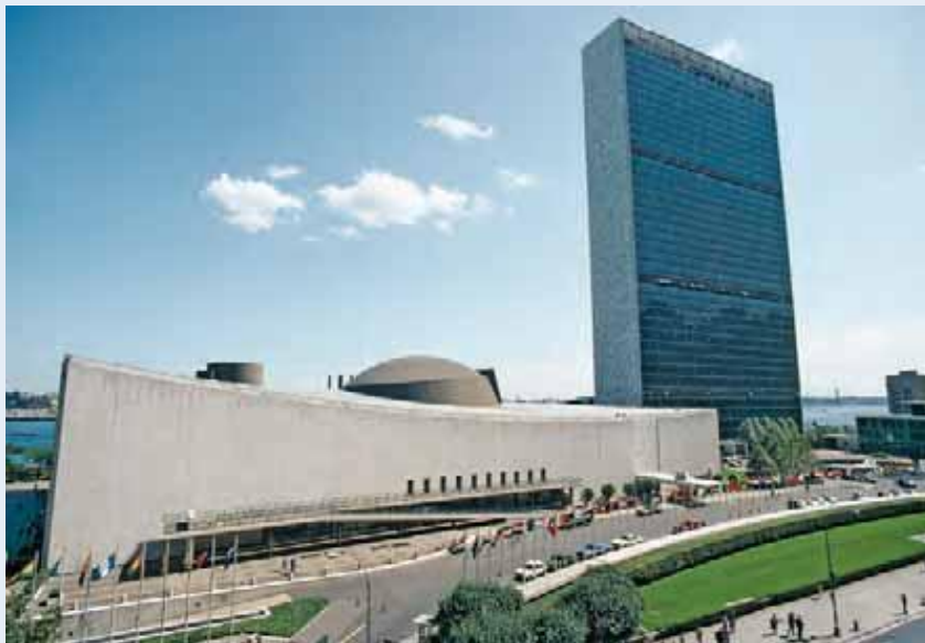
مقر سازمان ملل متحد در نیویورک امروز

در ۲۴ اکتبر سال ۱۹۴۹، دبیر کل سازمان ملل، تریگوی لی، سنگ بنای ساختمان ۳۹ طبقه ای را گذاشت. در تاریخ ۲۱ اوت سال ۱۹۵۰، کارکنان دبیرخانه آغاز به حرکت به دفاتر جدید خود کردند. ساختمان های مقر سازمان ملل متحد در نیویورک توسط یک تیم بین المللی از ۱۱ معمار از جمله اسکار نیمیر (برزیل) و لو کوربوزیه (سوئیس / فرانسه) تشکیل شده بود.