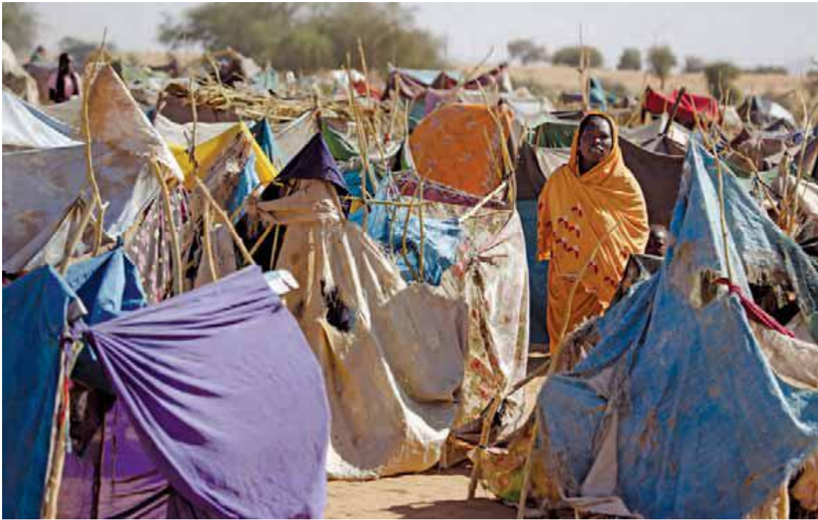
زنی در اردوگاه آوارگان زمزم در الفاشر شمال دارفور که بعد از درگیری های سیاسی میان دولت سودان و نیروهای شورشی برپا گردید.

« بازگشت کنندگان پناهندگان سابقند که به کشورها یا مناطق مبدأ پناه خود پس از مضي زمان در تبعید باز می گردند. مراجعت کنندگان به پشتیبانی مداوم و کمک برای ادغام مجدد نیاز دارند تا اطمینان حاصل شود می توانند زندگی شان را در خانه بازسازی کنند. در سال ۲۰۰۹، گزارش شد بیش از پنج میلیون آواره داخلی و ۲۵۱,۰۰۰ پناهنده به خانه بازگشته اند.