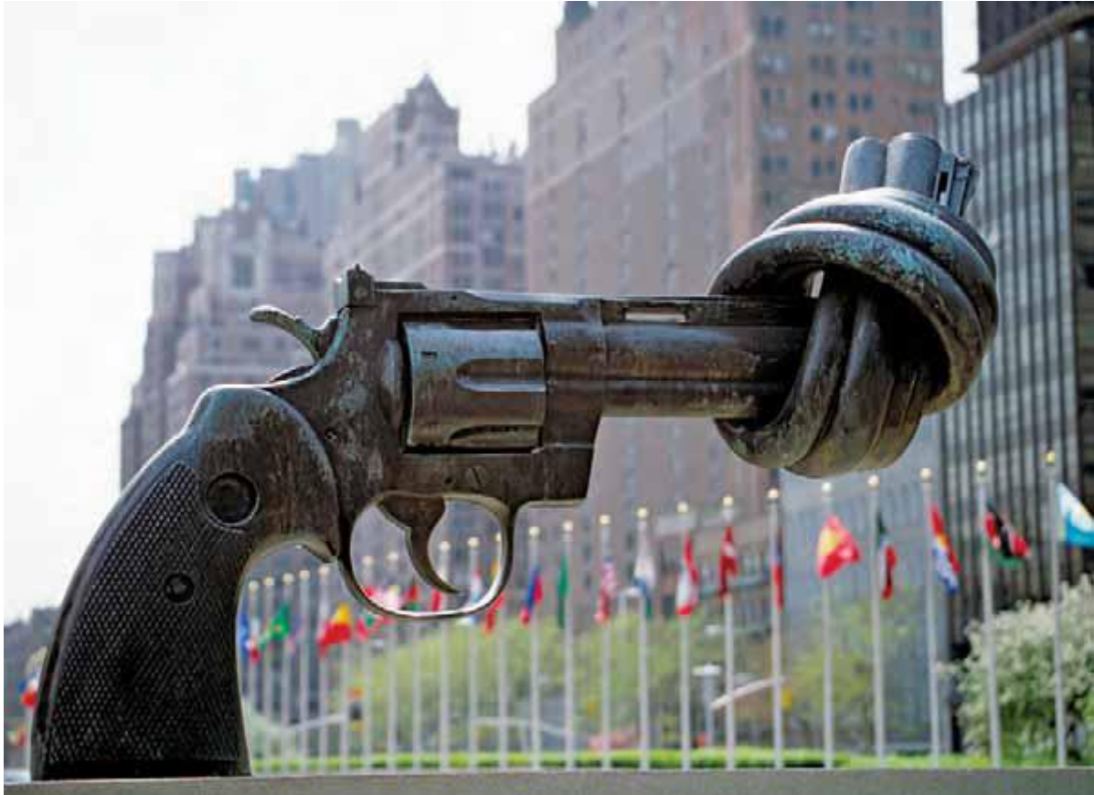
" هفت تیر Karl Fredrik Reutersward از جانب دولت لوگزامبورگ به سازمان ملل هدیه داده شده است. کره دار " نمادی برای صلح، کار

خشونت مسلحانه نه تنها زندگی ها را از بین می برد، بلکه اثر منفی بر اقتصاد گذارده، زیرساخت ها و اموال را صدمه زده، ارائه خدمات عمومی را محدود کرده، سرمایه گذاری در سرمایه های انسانی، اجتماعی و اقتصادی را تضعیف کرده به هزینه کردن های غیرمولد در خدمات امنیتی می انجامد. این پدیده، با در نظر گرفتن قاچاق و تردد زیاد جمعیت، دغدغه امنیتی داخلی و بین المللی است. همچنین نباید فراموش کرد که خشونت مسلحانه توسعه را تضعیف می کند و به منزله مانعی است در مسیر دستیابی به اهداف توسعه هزاره سازمان ملل متحد.