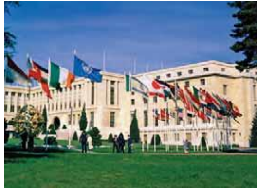
دفتر ملل متحد در ژنو