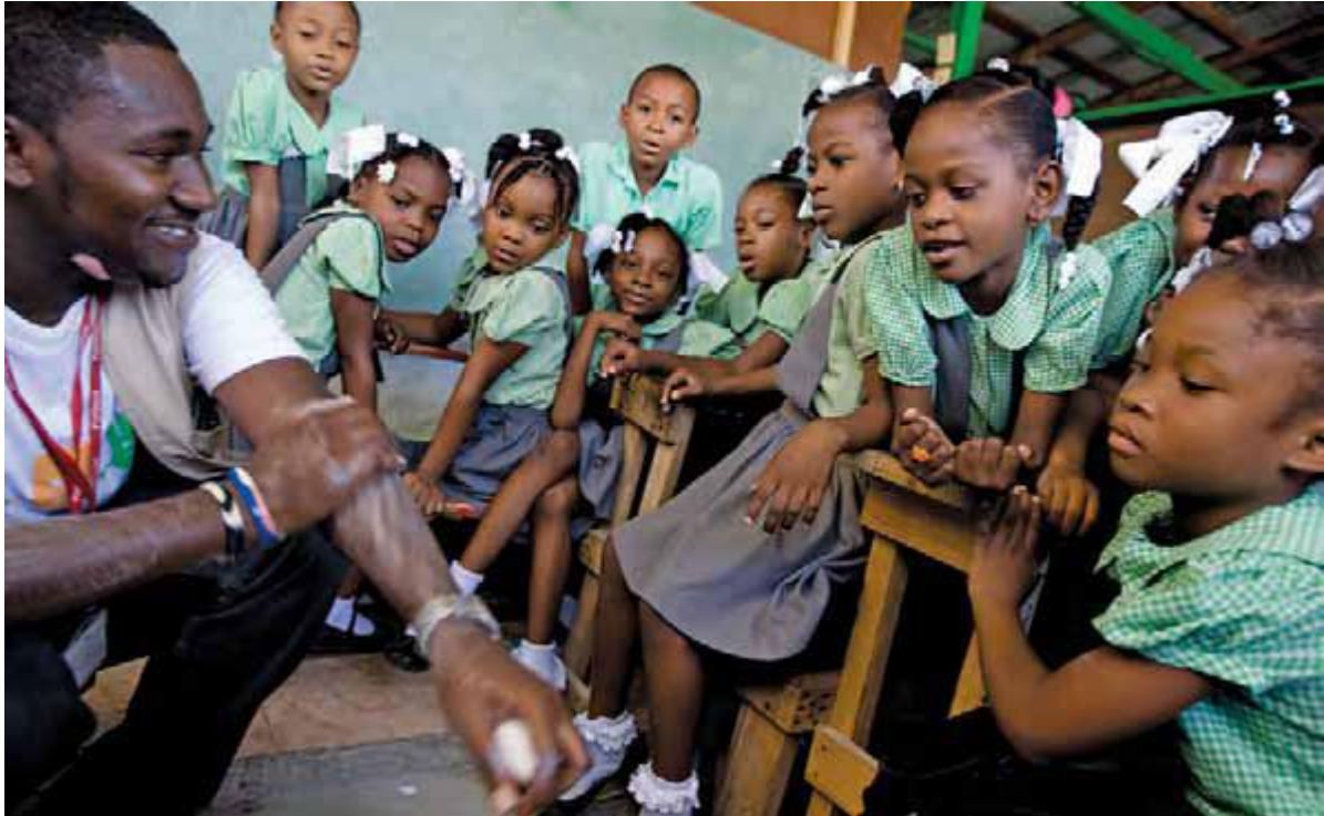
کرمند یونیسف نحوه صحیح شستن دست را در چارچوب مبارزه برای پیشگیری از وبا در پورتو پرنس هائیتی آموزش می دهد.