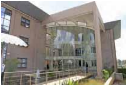
دفتر ملل متحد در نایروبی