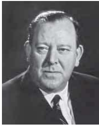
تریگوه لی (نروژ): ۱۹۵۲-۱۹۴۶