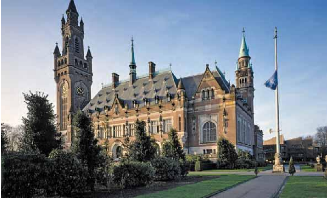
در پی مسابقه ای بین المللی، معمار فرانسوی لویی کوردونیه برنده طراحی کاخ صلح لاهه، هلند شناخته شد. این کاخ مقر دیوان بین المللی دادگستری و اسلاف آن از سال ۱۹۱۲ میلادی است.