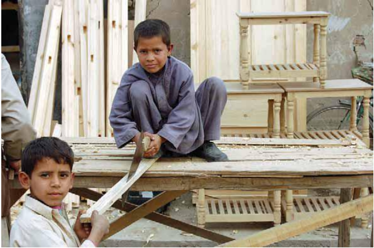
پسران جوان مهارت های نجاری را می آموزند تا به شش درصد کودکان ۵ تا ۱۴ ساله ای ملحق شوند که، طبق ارزیابی یونیسف، همین اکنون کار می کنند.