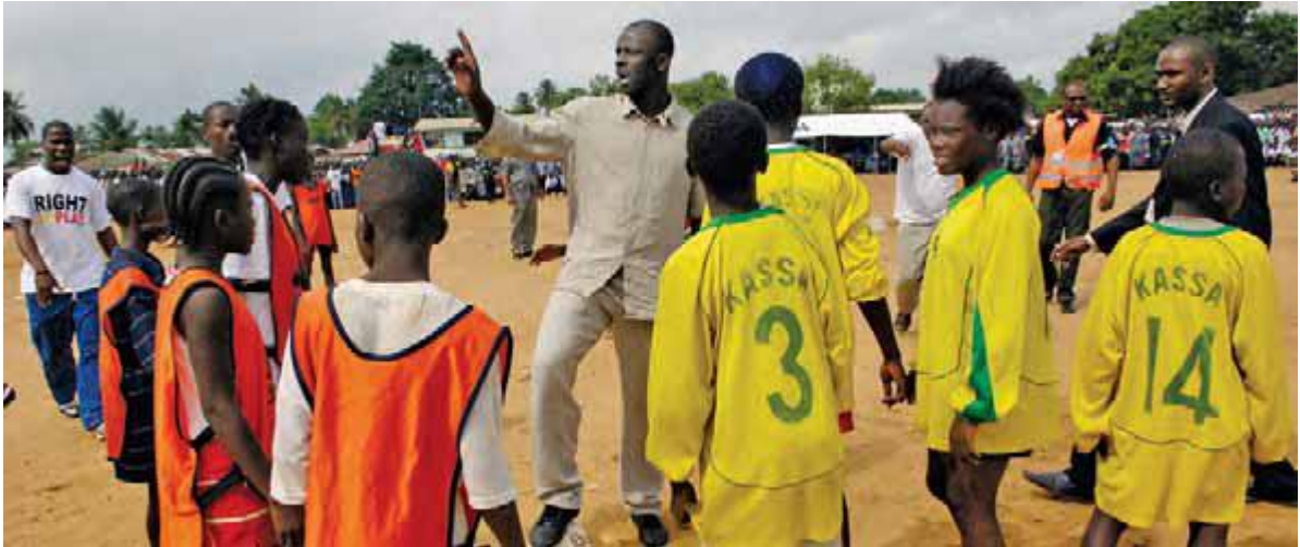
کودکان لیبرایی در برنامه ورزش برای صلح شرکت می کنند