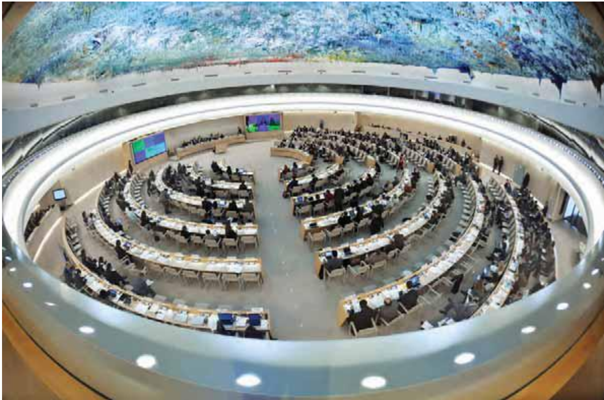
تالار شورای حقوق بشر در ژنو