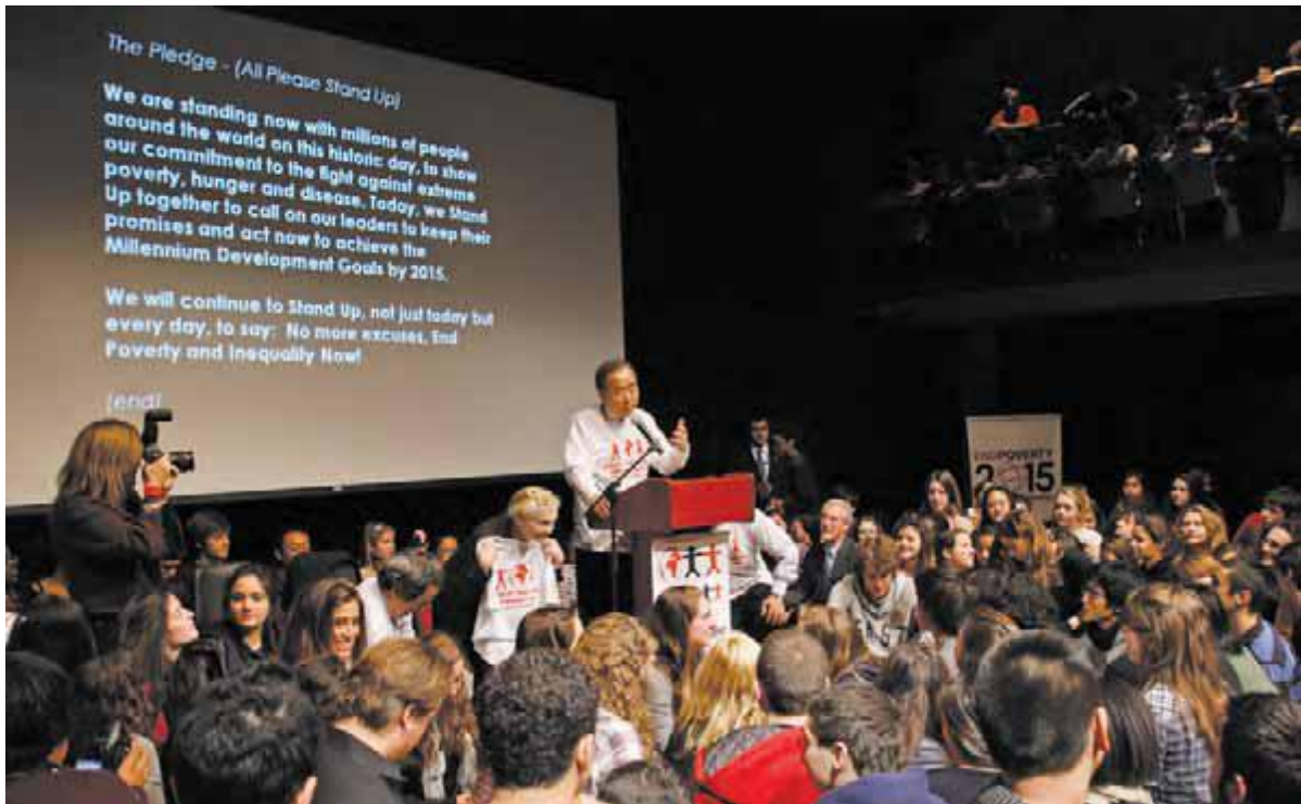
دبیرکل سازمان ملل متحد، بان کی مون، روی صحنه " قیام در برابر فقر" ایستاده که بر روی دیوار مدرسه بین المللی ملل متحد (UNIS) در نیویورک نقش بسته است.

فقیر بودن اغلب به این معنی است که از حقوق اقتصادی و اجتماعی مانند حق به مراقبت های بهداشتی، مسکن مناسب، آب و غذای سالم، آموزش و کار، محروم بمانیم. افراد فقیر در چرخه ای معیوب، بدون کار، منفعل شده اند. آنان پول ندارند، تا حدی که نمی تواند برای خدمات بهداشتی و مواد غذایی شان چیزی بپردازند. بزرگسالان بیمار و دچار سوء تغذیه نمی توانند سرکار بروند و فرزندانشان نمی توانند به مدرسه بروند. اما بدون آموزش و پرورش، این کودکان کار هم نمی توانند پیدا کنند. این امر در مورد حقوق مدنی و سیاسی چون حق برخورداری از محاکمه عادلانه، مشارکت سیاسی و امنیت شخصی هم صادق است. مردم فقیر احساس می کنند صدایی نداشته، هیچ کس ناله شان را نمی شنود.