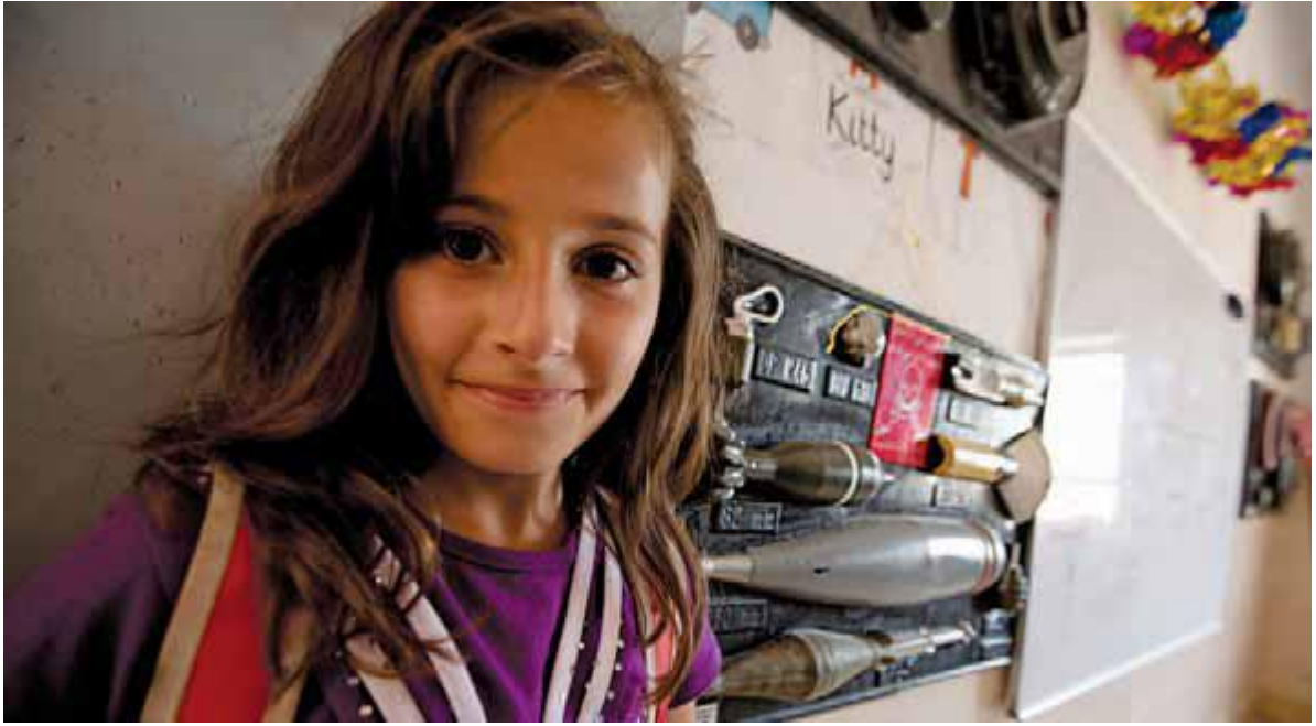
دختر عراقی در مورد خطر مین های زمینی به یمن برنامه آموزش خطرات مین یونیسف تعلیم می بیند