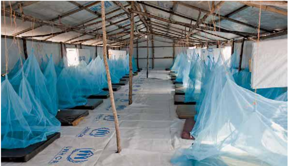
توره‌های ضد پشه قادرند گروه‌های در معرض خطر را از ابتلاء به مالاریا محافظت کنند.

« به تازگی، حدود ۹,۴ میلیون نفر در سراسر جهان در سال ۲۰۰۹ مبتلا به سل تشخیص داده شده اند. این تعداد در سال ۲۰۰۸ میلادی همین بود. » « در سال ۲۰۰۹، سل سبب مرگ حدود ۱,۳ میلیون نفر در میان اشخاصی شد که به اچ آی وی آلوده نشده بودند. تعداد ۰,۴ میلیون مرگ دیگر ناشی از سل در میان اشخاص اچ آی وی مثبت ثبت شده است. » « به گزارش راهبردی برنامه توقف سل سازمان جهانی بهداشت، بین سال های ۱۹۹۵ و ۲۰۰۹، در مجموع ۴۱ میلیون بیمار مبتلا به سل با موفقیت درمان شدند. در نتیجه، بیش از شش میلیون تن نجات یافتند.