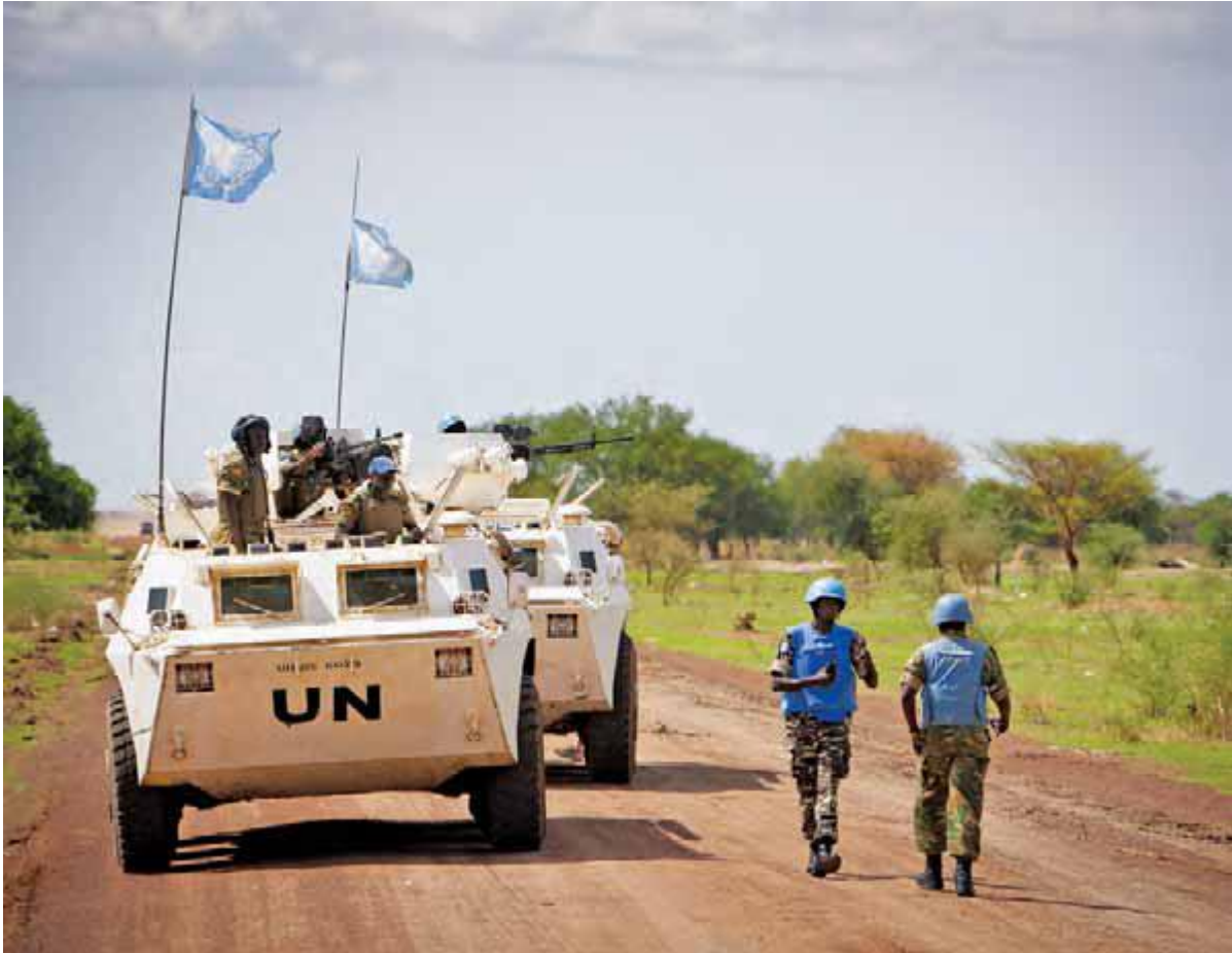
صلح بانان زامبیایی در سلک ماموران ملل متحد در سودان پیشاپیش گشت زرهی در منطقه بی‌ثبات آبیہ کام بر می‌دارند

خیر، سازمان ملل متحد هیچ نیروی بین‌المللی دائمی نظامی یا انتظامی ندارد. سربازانی که در عملیات حفظ صلح سازمان ملل متحد خدمت می‌کنند به صورت داوطلبانه توسط دولت‌های عضو تأمین شده‌اند. غیرنظامیانی که اغلب از میان کارکنان سازمان ملل متحد برکشیده شده‌اند هم نقش کلیدی در شکل‌گیری این عملیات ایفا می‌کنند.