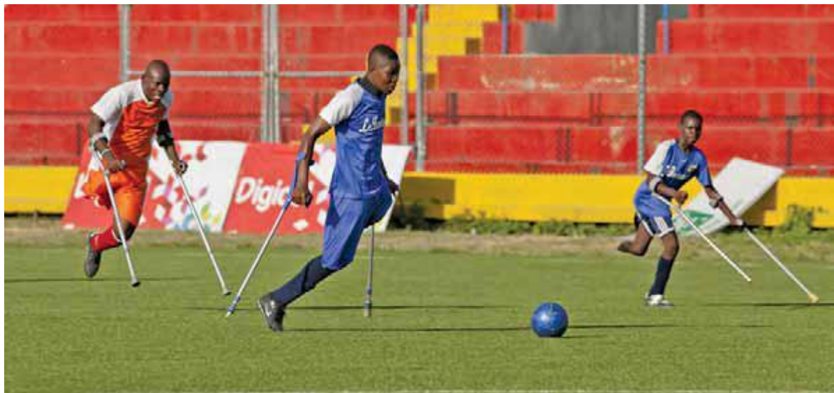
بازیکنان در مسابقه ای برای مردان معلول در ورزشگاه ملی پورتو پرنس هائیتی رقابت می کنند

کنوانسیون حقوق افراد دارای معلولیت پاسخ جامعه بین المللی است به تاریخ طولانی تبعیض، محرومیت و انسانیت زدایی از این گروه به حاشیه رانده شده. تعداد چشمگیری از کشورها کنوانسیون و پروتکل آن را امضا کرده اند.