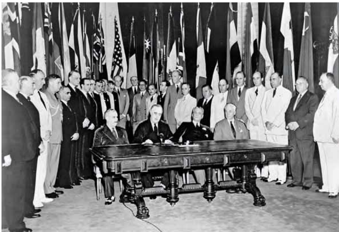
امضا اعلامیه ملل متحد (۱ ژانویه ۱۹۴۲)

سه سال بعد، هنگام تدارک کنفرانس سان فرانسيسكو، تنها آن دسته از کشورهایایی که به متحدین اعلام جنگ داده و عضو بیانیه ماه مارس ۱۹۴۵ سازمان ملل متحد بودند به شرکت در آن کنفرانس دعوت شدند.