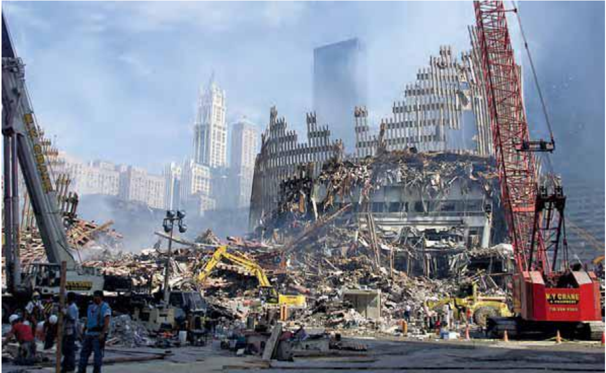
دبیرکل وقت سازمان ملل متحد، کوفی عنان، یک هفته پس از حملات تروریستی ۱۱ سپتامبر ۲۰۰۱ از محل حادثه دیدن کرد.