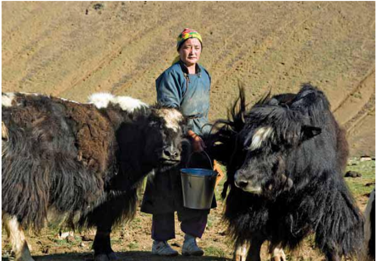
طرح برنامه توسعه ملل متحد کمک کرد گروه های کله دار در مغولستان معیشت خود را بهبودی بخشند و همزمان تنوع زیستی منطقه نیز حفظ شود.

از دید همه کشورها، جامعه جهانی برای تحصیل منفعت جهانی شدن باید به کار خود در کاهش انحرافات موجود در روند تجارت جهانی (مثل قطع یارانه های کشاورزی و موانع تجارت) که به نفع کشورهای توسعه یافته بوده ادامه دهد تا نظامی منصفانه تر برای همگان ایجاد کند.