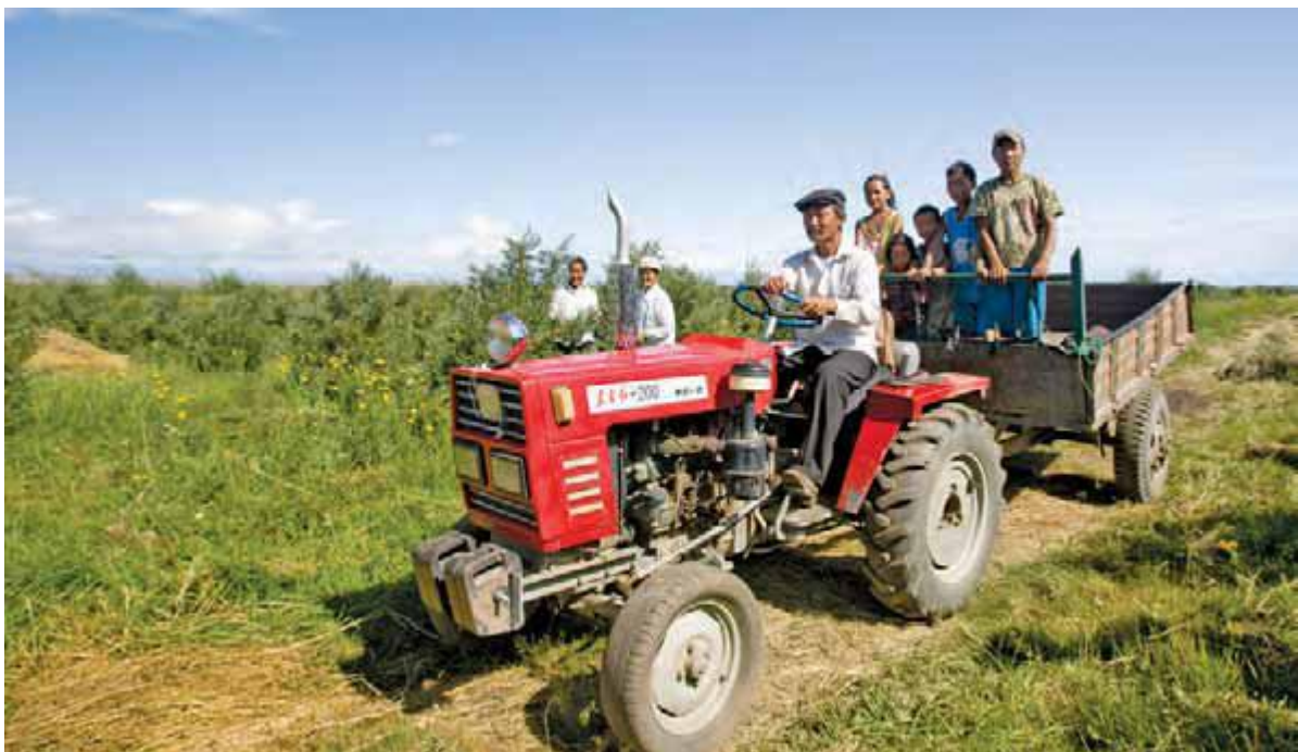
کشاورزان مغول از طرحی بهره مند می شوند که توسط برنامه توسعه ملل متحد اداره شده و به آنان امکان می دهد زمین های بلا استفاده را به پارک های کشاورزی مبدل سازند.