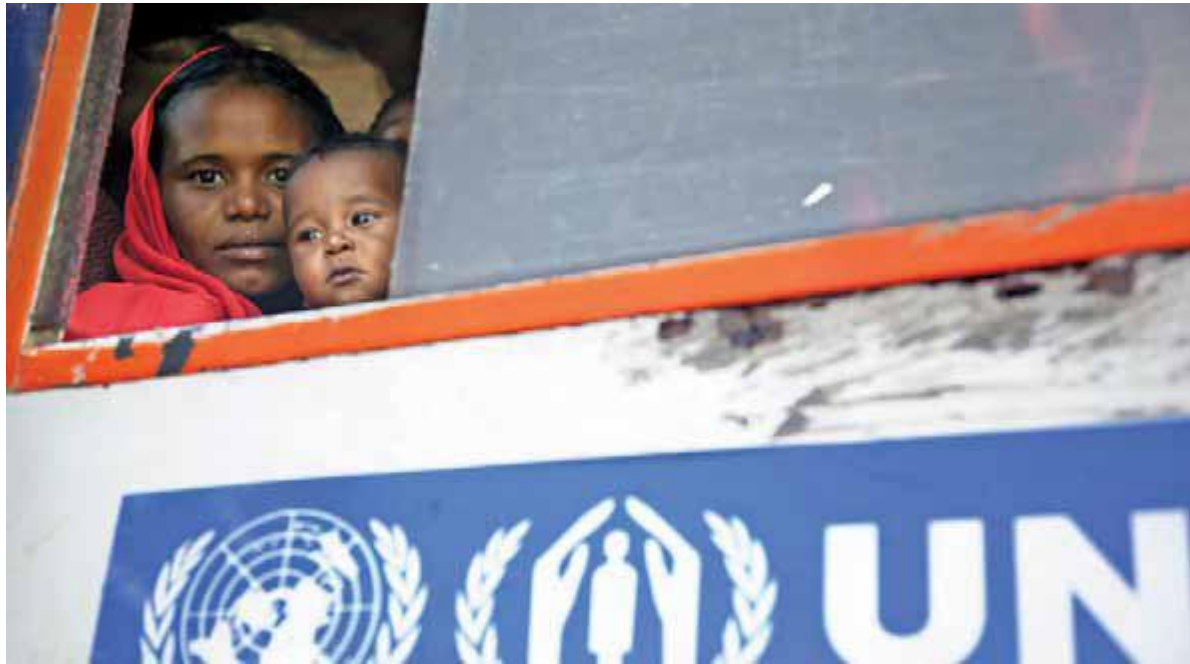
مادر و دخترش از کمپ آرامبا به دهکده محل سکونتشان در سه جانا شمال دارفور باز می گردند.