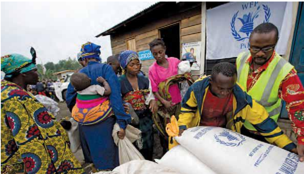
امداد اضطراری مواد غذایی در کیوو شمالی، جمهوری دموکراتیک کنگو.

با وجود چنین تفاوت های بسیاری، اشتراکی زیاد میان آنان برقرار است. امدادورزان بشردوست خود را وقف کمک به کسانی می کنند که به یاری شان نیازمندند، فارغ از نژاد، مذهب و موقعیت اجتماعی دریافت کننده کمک. آنان در مکان هایی فعالند که اغلب دور، دشوار و نامساعدند. آنان زندگی خودشان را برای کمک به دیگران به خطر می اندازند. بسیاری همکاران یا عزیزان شان را در طول سال ها از دست داده اند. کار انسان دوستانه خطرناک تر شده است. سطح تهدیدات و تعداد حملات عمدی به سازمان های کمک رسانی، و کارکنان، تجهیزات و امکانات شان به نحوی چشمگیر بالاتر رفته است. در سال ۲۰۱۰، ۲۴۲ امدادگر، کشته، مجروح یا ربوده شدند.