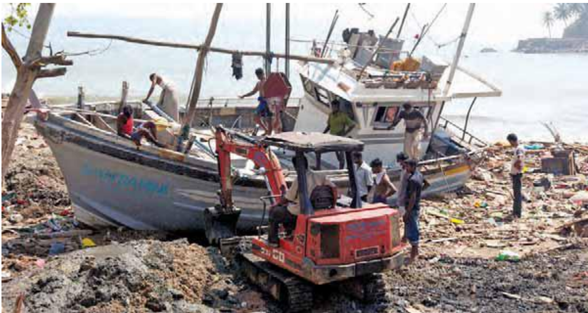
سريلانكا بعد از سونامی ۲۶ دسامبر ۲۰۰۴

نوع دیگری از فجایع، زاده دست انسان است که با درگیری یا جنگ های داخلی ایجاد می شود. بلاایای ساخته دست بشر میلیون ها نفر را در سراسر جهان بی خانمان کرده منجر به حدوث طیف گسترده ای از شرایط اضطراری، از جمله بحران های غذایی و جابه جایی های عظیم جمعیت می شود. قربانیان فجایع انسانی معمولاً مجبور به ترک خانه و زندگی خود شده در لبه پرتگاه وجود بی حمایت از حقوق اولیه شان به سر می برند. در زمان تبعید، بسیاری در معرض خشونت، سوء استفاده یا بهره کشی قرار می گیرند. آنان ممکن است در به دست آوردن امکانات تامین آب سالم به مشکل برخوردند چرا که چاه ها اغلب آلوده یا توسط رزمندگان درجنگ مین گذاری شده است. گرسنگی و سوء تغذیه، از دست دادن ایمنی و امنیت و دسترسی اندک به خدمات اساسی، به ویژه مراقبت های بهداشتی، نمونه هایی است از دشواری های ایجاد شده با بلاایای ساخته دست بشر.