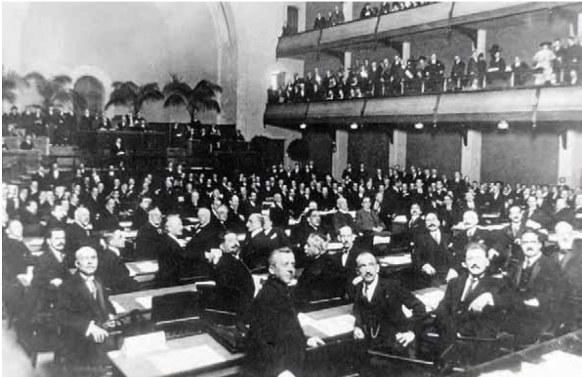
جلسه افتتاحیه جامعه ملل در ژنو